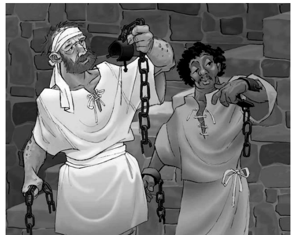
Kisah Para Rasul 16:1-34

Apa yang akan adik-adik lakukan kalau adik-adik lagi sedih? ( tunggu anak-anak menjawab ). Apa yang akan adik-adik lakukan kalau adik-adik lagi senang? ( tunggu anak-anak menjawab ).