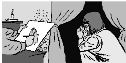
1. Hand Clutching prayer, c. 1500, Albrecht Dürer. Karya ini merupakan sketsa yang dibuat oleh Dürer untuk menggambarkan tangan yang berdoa. Karya ini adalah salah satu dari banyak karya Dürer yang menunjukkan detail anatomi yang sangat akurat. Karya ini juga menunjukkan detail anatomi yang sangat akurat. Karya ini juga menunjukkan detail anatomi yang sangat akurat. Karya ini juga menunjukkan detail anatomi yang sangat akurat.

Kini, galeri-galeri lukisan di dunia memamerkan karya-karya Albrecht, tak terkecuali lukisannya "Tangan Yang Berdoa" yang menyimbolkan kasih, pengorbanan, kerja keras, dan rasa terima kasih yang dalam.